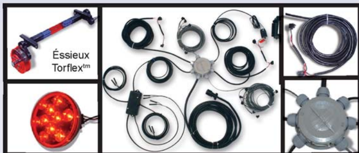
Système de filage pour conditions extrêmes. Lumières DEL standard.